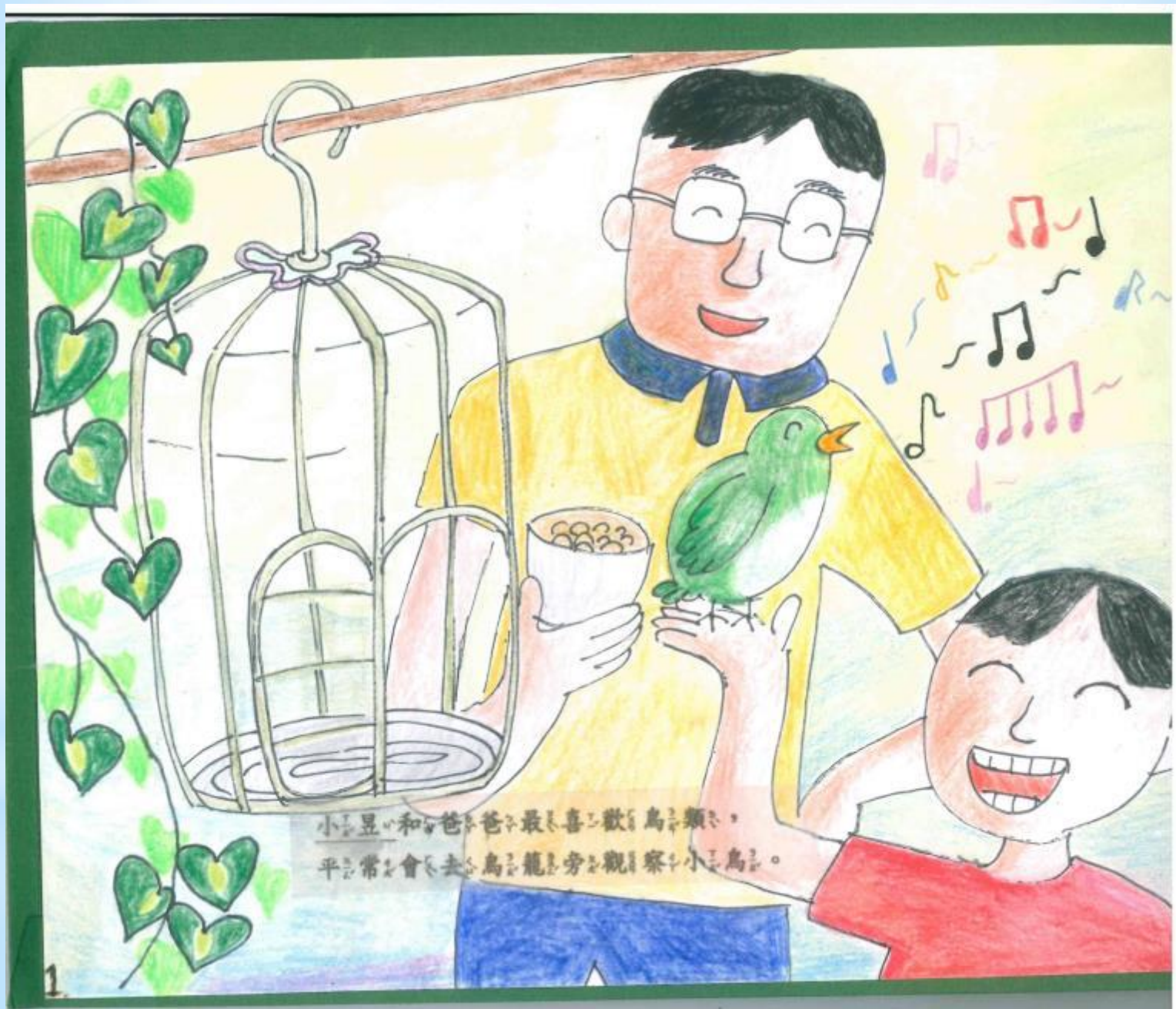
小豆の和爸爸最喜欢的小鸟， 平常会和去鸟笼旁观察小鸟。