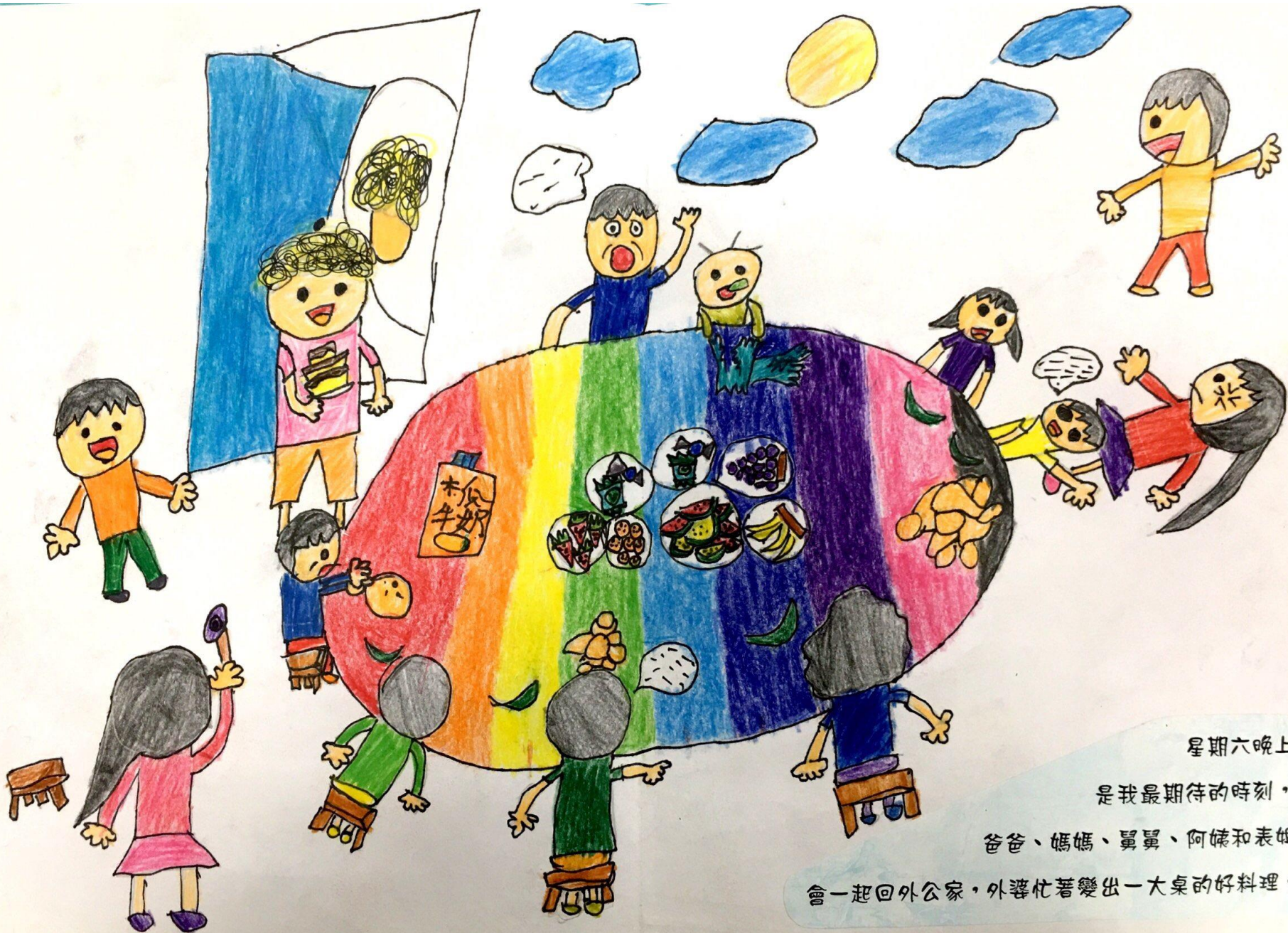
星期六晚上 是我最期待的時刻， 爸爸、媽媽、舅舅、阿嬤和表姐 會一起回外公家，外婆忙著變出一大桌的好料理。