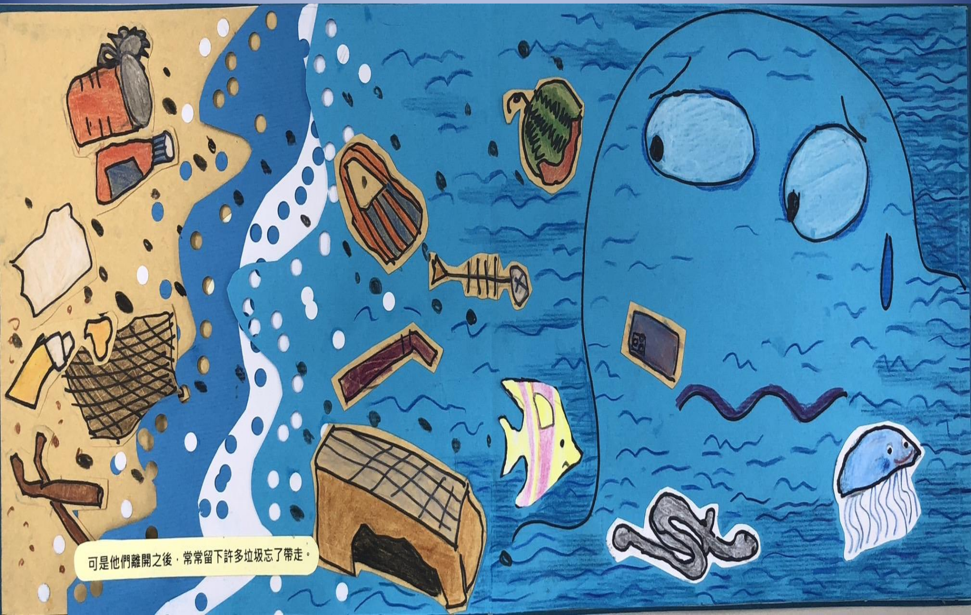
可是他們離開之後，常常留下許多垃圾忘了帶走。