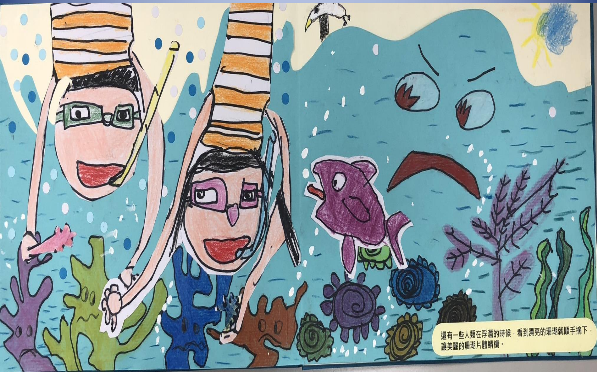
還有一些人類在浮潛的時候，看到漂亮的珊瑚就順手摘下，讓美麗的珊瑚片體鱗傷。