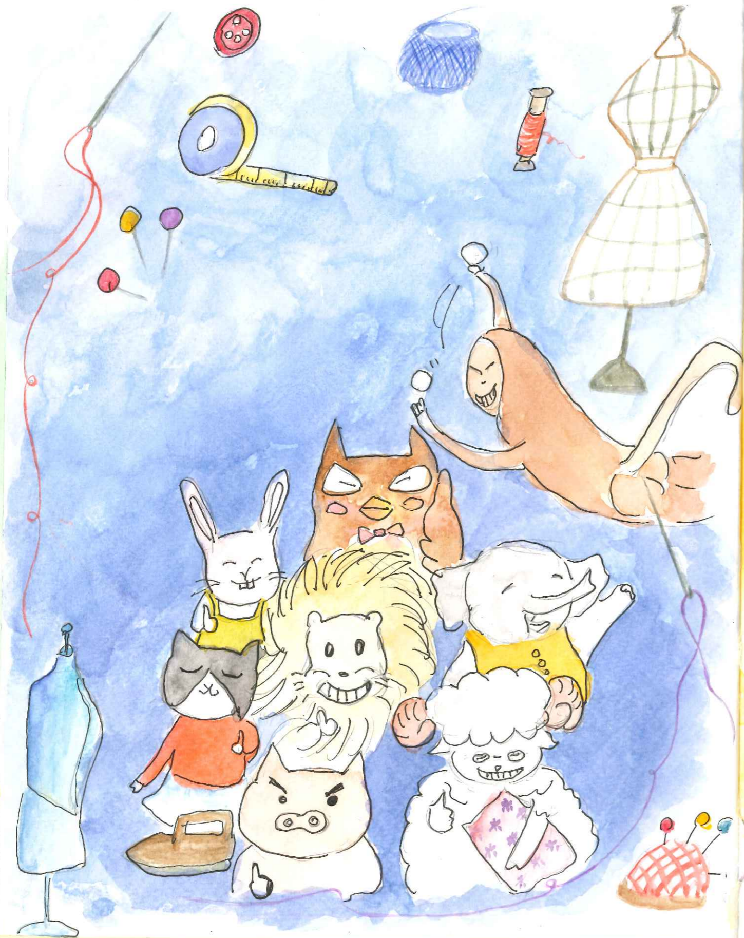
大家都對老裁縫的技術讚嘆不已。