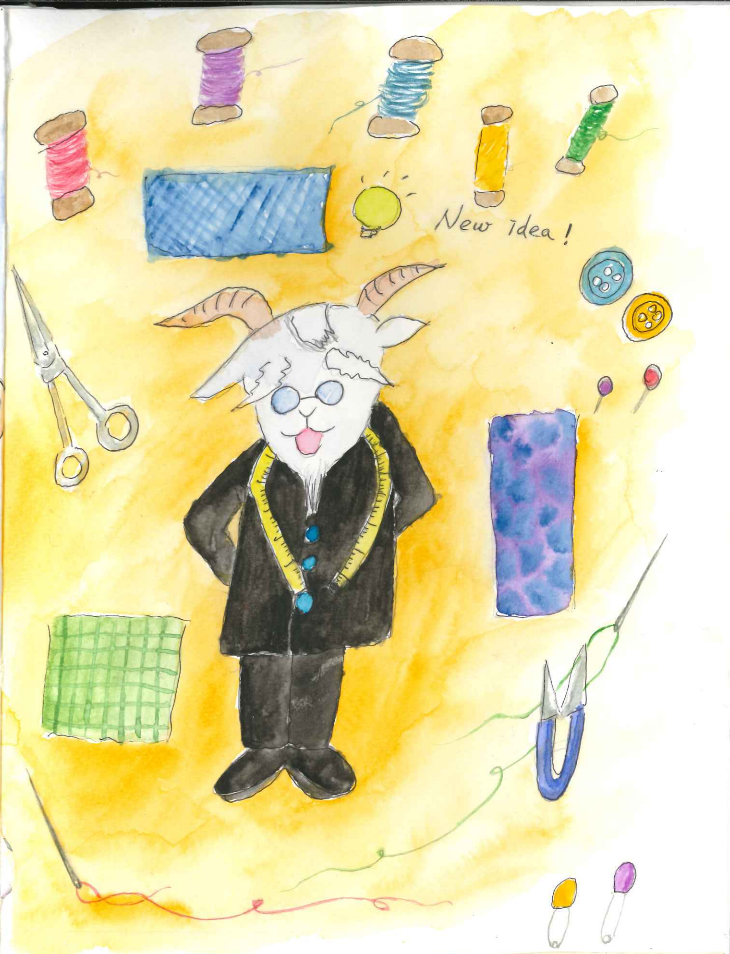
舊布新生，是老裁縫的新主張。